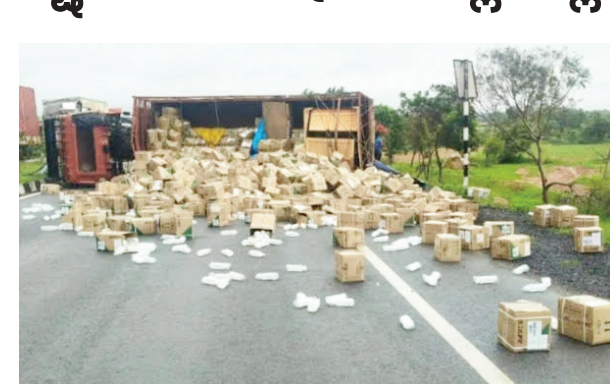
ಔಷಧ ತುಂಬಿದ ಪೆಟ್ಟಿಗೆಗಳು ಚೆಲ್ಲಾ ಪಿಲ್ಲಿಯಾಗಿ ಬಿದ್ದಿವೆ. ಕೋಟಗಟ್ಟಲೆ ಬೆಲೆಬಾಳುವ ಔಷಧಿಗಳು ವ್ಯರ್ಥವಾಗಿದೆ. ಅವಘಾತದಲ್ಲಿ ಚಾಲಕರಾದ

ಕೊಪ್ಪಳ,ಮೇ.27-ಯಲಪುರ್ಗ ತಾಲೂಕಿನ ಮಹಾಲಕ್ಷ್ಮಿನಗ್ರಾಮದ ಬಳಿ ರಾಷ್ಟ್ರೀಯ ಹೆದ್ದಾರಿ 50 ರಲ್ಲಿ, ಚಾಲಕ ನಿರ್ದಯ ಮಂಪರಿನಲ್ಲಿ ತಡೆಗೋಡೆಗೆ ಡಿಕ್ಕಿ ಹೊಡೆದ ಪರಿಣಾಮ ಲಾರಿಯೊಂದು ಪಲ್ಲಿಯಾಗಿ ಲಕ್ಷಾಂತರ ರೂಪಾಯಿ ಮೌಲ್ಯದ ಔಷಧಿಗಳು ಚೆಲ್ಲಾ ಪಿಲ್ಲಿಯಾಗಿ ಬಿದ್ದಿವೆ.